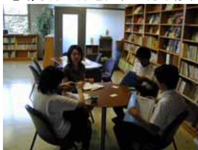
市民活動センターたちかわ