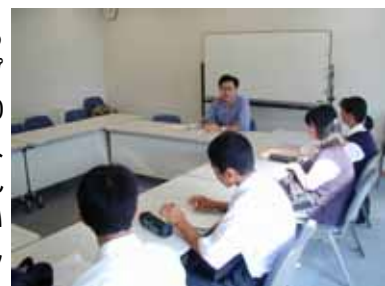
たちかわパソコン倶楽部