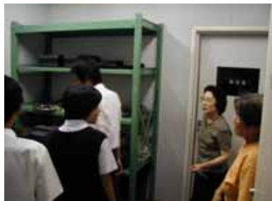
朗読サークル「こえ」