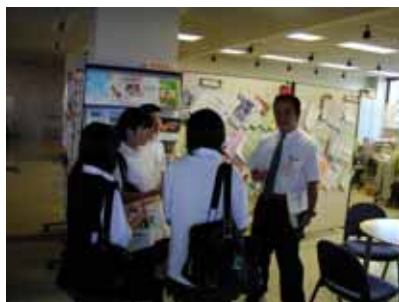
地域あんしんセンターたちかわ

生徒たちは今後、この事前の学習を受けて11月に2日間、実際の福祉施設での体験学習を行う予定とのことです。