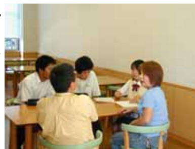
立川市聴覚障害者協会