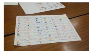
↑見守りマップ作りも検討

この1年、「防災」や「助け合い」についての学習会などを通して、交流活動や防災の取り組みを一層進めていこうという気運が高まり、今年4月、自治会防犯防災部の配下に「見守り班」が結成されました。毎月、会合には15名程の班員が集まります。