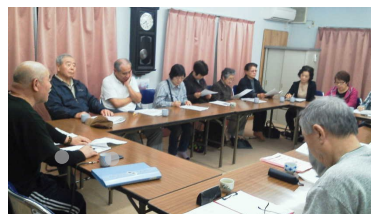
↑何だか、とても仕事が早い面々

ゴールデンウィークには全戸にアンケートを配布し、災害時に支援が必要な人が実態としてどのくらいいるのか、の調査が始まりました。その結果を踏まえて、どの活動から取り組むのかを考えていきます。