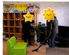
そうじふうけい 掃除風景