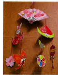
りようしゅ さく 利用者さん作 ひなかさ 雛飾り

掃除機を使って丁寧に掃除した後、3日のゆるっとでは、ひな祭りの思い出を語り合いました。ひな壇やちらし寿司をいただいたことなど、幼少の頃の思い出を懐かしみながら語り合いました。19日は、4月からプログラムとして企画された「たあふく通信」の発送準備のプレ作業を行いました。折る、封筒詰め、糊付けの3工程を参加者で行い、その後の職員による宛名ラベル貼りや発送までの全工程を確認することが出来ました。貴重な経験を共有させていただき、ありがとうございました！