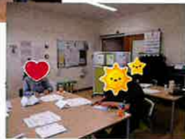
はっそうじゅんびふうけい 発送準備風景