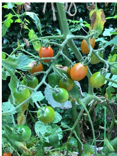
み 実をつけたトマト