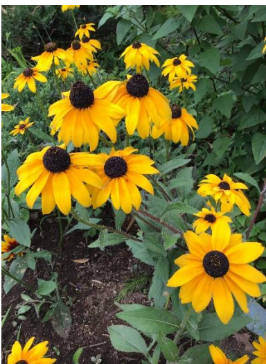
ロータリーで咲く花