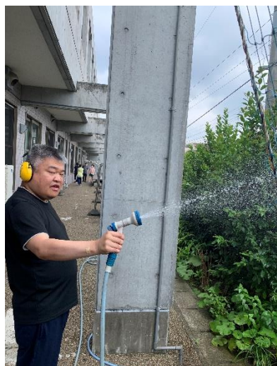
えんけいかつどう ようす 園芸活動の様子

また そごうふくし 総 そごうふくし 合 そごうふくし 福 そごうふくし 祉 そごうふくし セ そごうふくし ン そごうふくし タ そごうふくし ー そごうふくし の そごうふくし ロ そごうふくし ー そごうふくし タ そごうふくし リ そごうふくし ー そごうふくし の そごうふくし 一 そごうふくし 部 そごうふくし で そごうふくし 花 はな を そだ 育 そだ てて そだ います。こ みず ち みず ら みず も みず 水 みず や みず り みず を まい 毎 まい 日 まい 行 まい い、色 いろ と いろ り いろ ど いろ り いろ の いろ 花 はな が はな 咲 はな いて はな います。み だい ん だい な だい で だい 大 だい 事 だい に だい 育 そだ て、 そごうふくし 総 そごうふくし 合 そごうふくし 福 そごうふくし 祉 そごうふくし セ そごうふくし ン そごうふくし タ そごうふくし ー そごうふくし に らい 来 らい 館 らい さ らい れる らい 全 すべ て すべ の すべ 人 ひと に、 たの 楽 たの し たの ん たの で たの も たの ら たの い たの たい たの と思 おち います。