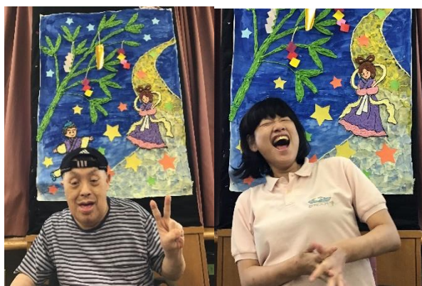
彦星と織姫の再会を笑顔でお祝い

午後は、ゲーム大会「願い事が叶いますように☆～願い玉運び競争！～」、七夕の願いを込めた「願い玉」を、おたまに乗せたら一斉にスタートです。ゆっくりと落とさないように大事にゴールまで運びます。願いを乗せて運ばれていく「願い玉」が、「流れ星」のように、七夕の願いを叶えてくれますように。