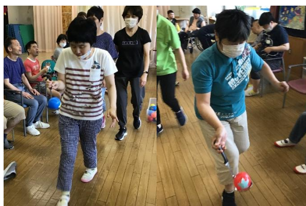
七夕の願いを込めて頑張りました