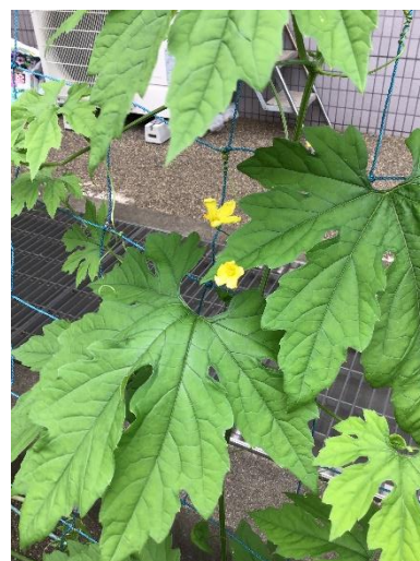
はな 花が咲いたキュウリ