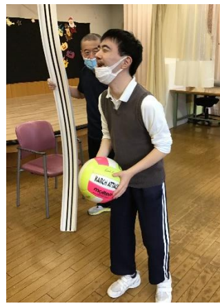
→おばけペットボトル